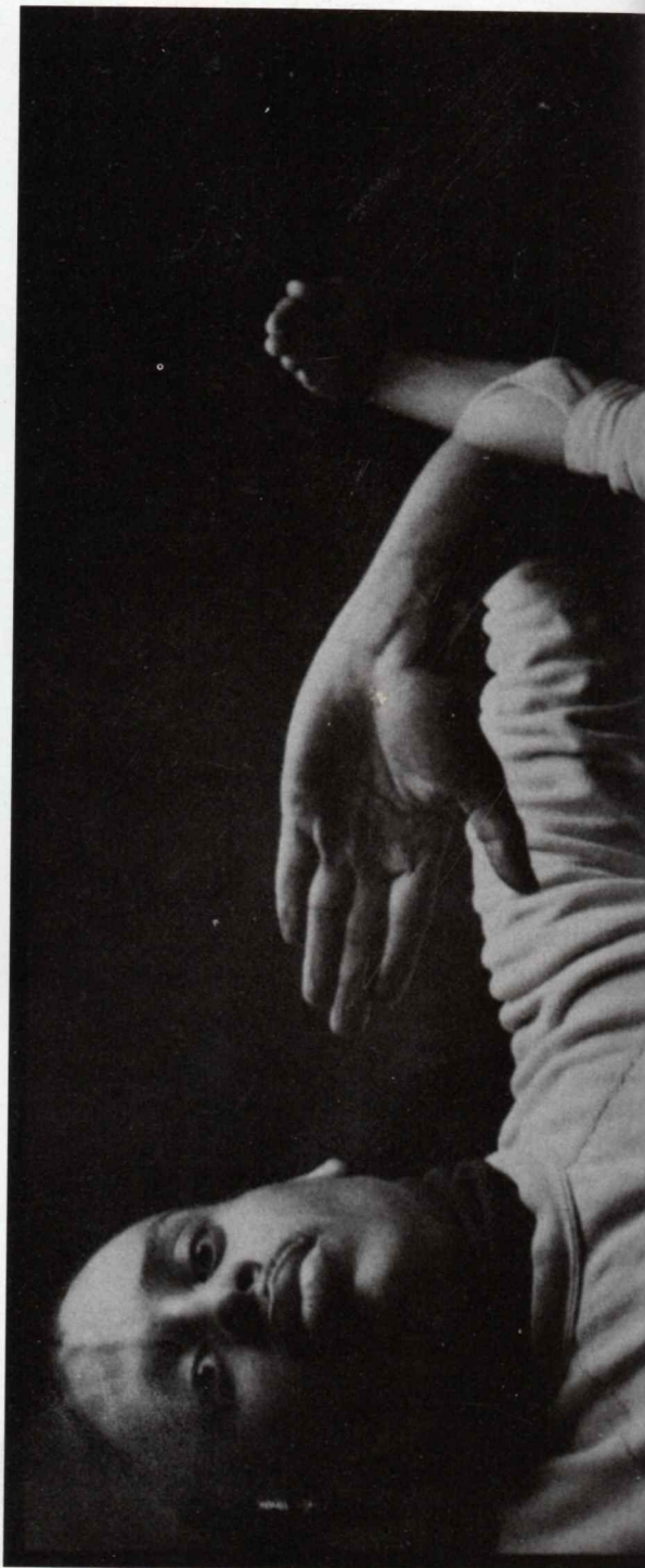
Willie Ninja, uno dei più famosi vogueurs del mondo. Pratica ed insegna

"Certo. Tutte le altre modelle spariscono quando arriva lei con il suo